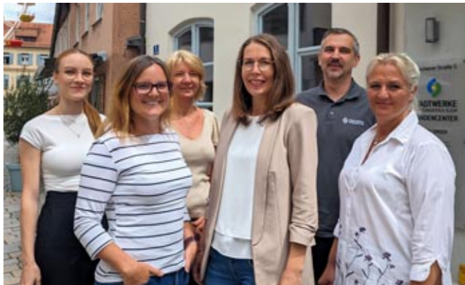
Wir sind für Sie da: Ihr Kundencenter-Team