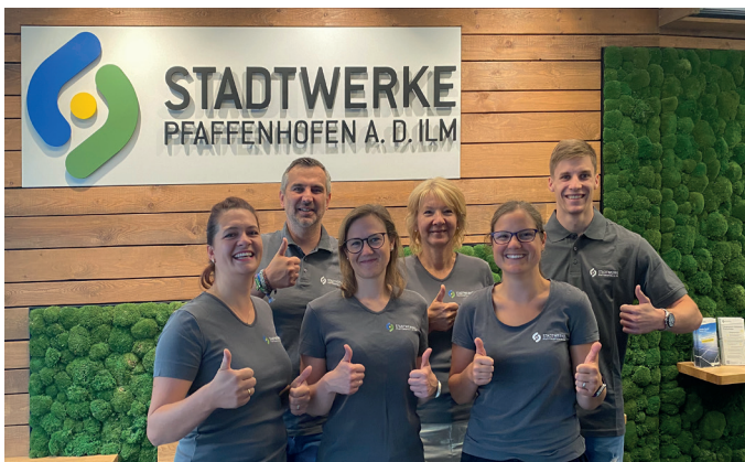
Wir sind für Sie da: Ihr Kundencenter-Team