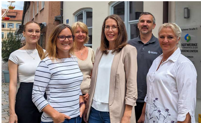
Wir sind für Sie da: Ihr Kundencenter-Team